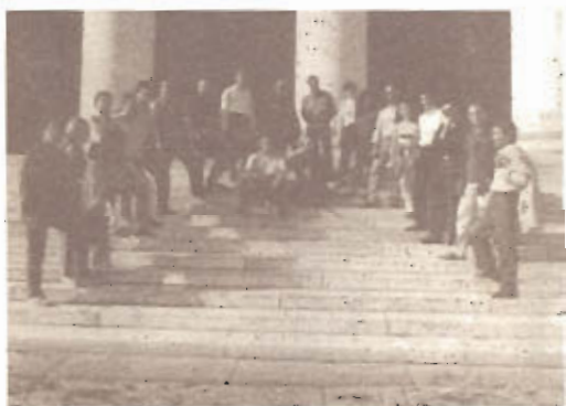
L'ORCHESTRA DA CAMERA DI NAPOLI

Perché Mozart sarebbe venuto a Napoli ed avrebbe scritto per Ferdinando IV se non sperando di diventare compositore di Corte? Stilisticamente e anche dal punto di vista dell'armonia è ascrivibile a Mozart il quale avrebbe "plagiato" Anfossi semplicemente per motivi di scadenza volendo terminare in fretta il Requiem... Per il celebre compositore di Salisbur-