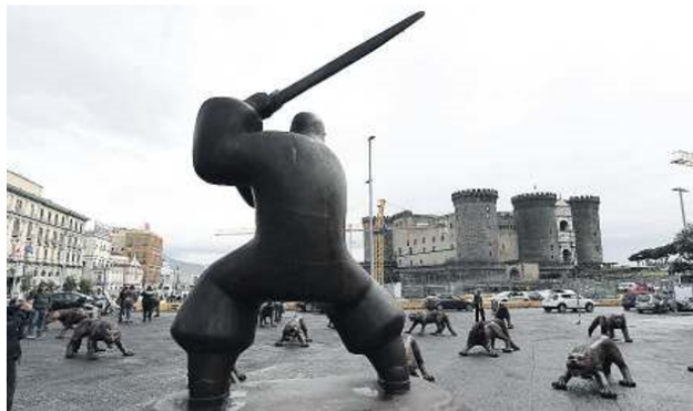
PIAZZA MUNICIPIO L'installazione dell'artista cinese Liu Ruowang

lasso e Riccardo Betteghella), testomonal della manifestazione, che hanno declinato da tempo i temi del Sud nei loro sketch divenuti famosi sul canale YouTube. Da segnalare, tra gli eventi da non perdere, il festival Sacro Sud Anime Salve 2.0 , una rassegna di 12 concerti con la direzione artistica di Enzo Avitabile. Il progetto musicale, giunto alla seconda edizione, è stato ideato per essere un dialogo della pace e della tolleranza, della solidarietà e dell'aggregazione. Un incontro unico che parla di musica e sacralità. La programmazione natalizia si compone inoltre di un altro importante festival dedicato alla scuola musicale napoletana del settecento: il Festival Internazionale del '700 musicale napoletano, che quest'anno realizza la sua ventesima edizione. Il Festival, diretto dal maestro Enzo Amato ed organizzato dall'associazione Domenico Scarlatti, ha il grande merito di riportare alla luce la produ-