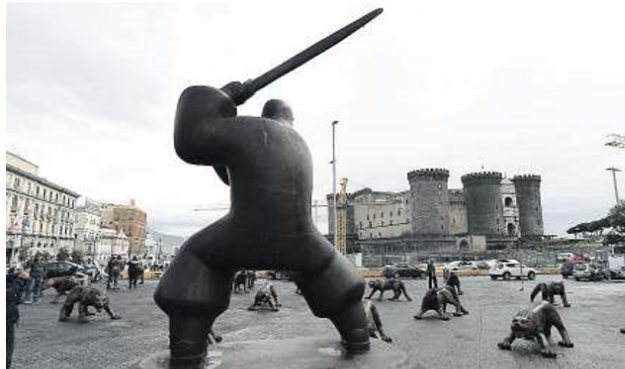
PIAZZA MUNICIPIO L'installazione dell'artista cinese Liu Ruowang

lasso e Riccardo Betteghella), testomonal della manifestazione, che hanno declinato da tempo i temi del Sud nei loro sketch divenuti famosi sul canale YouTube. Da segnalare, tra gli eventi da non perdere, il festival Sacro Sud Anime Salve 2.0 , una rassegna di 12 concerti con la direzione artistica di Enzo Avitabile. Il progetto musicale, giunto alla seconda edizione, è stato ideato per essere un dialogo della pace e della tolleranza, della solidarietà e dell'aggregazione. Un incontro unico che parla di musica e sacralità. La programmazione natalizia si compone inoltre di un altro importante festival dedicato alla scuola musicale napoletana del settecento: il Festival Internazionale del '700 musicale napoletano, che quest'anno realizza la sua ventesima edizione. Il Festival, diretto dal maestro Enzo Amato ed organizzato dall'associazione Domenico Scarlatti, ha il grande merito di riportare alla luce la produ-